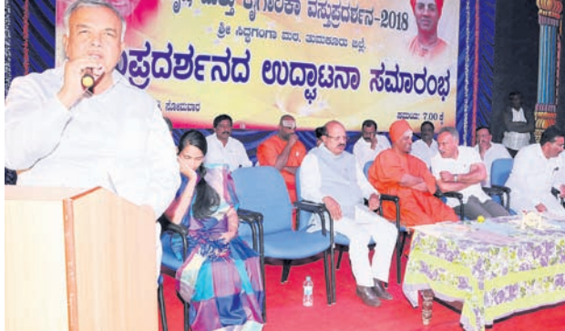
ವಸ್ತು ಪ್ರದರ್ಶನದ ಉದ್ಘಾಟನೆ ಸಮಾರಂಭ ಶ್ರೀ ಸಿದ್ದಗಂಗಾ ಮಹಾಲಕ್ಷ್ಮಿ ಆರ್ಟ್ ಗ್ಯಾಲರಿ

ತುಮಕೂರು ಜಿಲ್ಲೆಯಲ್ಲಿ ಪ್ರತಿದಿನ 50 ಸಾವಿರ ಜನ ವಸ್ತು ಪ್ರದರ್ಶನ ವೀಕ್ಷಿಸುತ್ತಿದ್ದಾರೆ. ಇವರಲ್ಲಿ ಬಹುತೇಕ ರೈತರು ವರ್ಗವಿಧ್ಯೆ ಕೃಷಿ ಕುರಿತು ತಮ್ಮ ಅರಿವನ್ನು ಹೆಚ್ಚಿಸಿಕೊಳ್ಳುತ್ತಿದ್ದಾರೆ ಎಂದು ಗೃಹ ಸಚಿವ ರಾಮಲಿಂಗಾರಡಿ ತಿಳಿಸಿದರು. ಅವರು ಸೋಮವಾರ ಸಂಜೆ ಸಿದ್ದಗಂಗಾ ಜಿಲ್ಲೆಯಲ್ಲಿ ಕೃಷಿ ಮತ್ತು ಕೈಗಾರಿಕಾ ವಸ್ತು ಪ್ರದರ್ಶನ ಉದ್ಘಾಟನೆ ಮಾಡಿದರು. ಓಂಪೆ ಹಳ್ಳಿಯ ತಳೆಯಿಂದ ಹೆಚ್ಚು ಇಳುವರಿ ಬರುತ್ತಿರಲಿಲ್ಲ. ಇಂದು ಕಡಿಮೆ ಕಾಲದಲ್ಲಿ