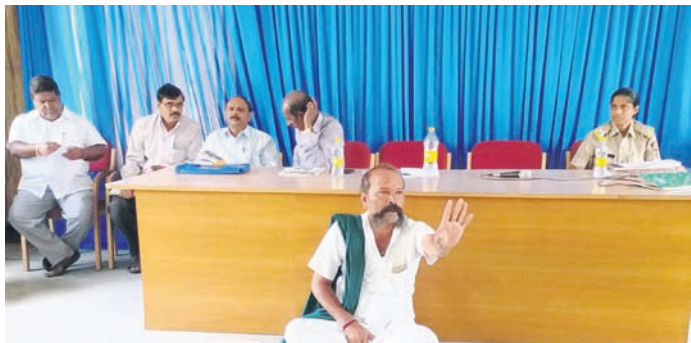
ಜಿಲ್ಲಾಧಿಕಾರಿಗಳ ಕಛೇರಿ ಸಭಾಭವನದಲ್ಲಿ ಜನಸ್ಪಂದನ ಸಭೆಯ ವೇದಿಕೆ ಎದುರು ಧರಣಿ ನಡೆಸಿದ ಘಟನೆ