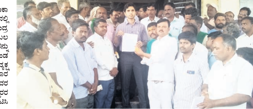
ಜಿಲ್ಲಾಧಿಕಾರಿಗಳ ಕಛೇರಿ ಸಭಾಭವನದಲ್ಲಿ ಜನಸ್ಪಂದನ ಸಭೆಯ ವೇದಿಕೆ ಎದುರು ಧರಣಿ ನಡೆಸಿದ ಘಟನೆ