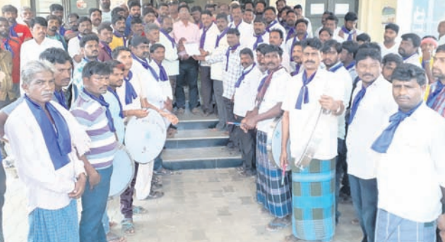
ಜಿಲ್ಲಾಧಿಕಾರಿಗಳ ಕಛೇರಿ ಸಭಾಭವನದಲ್ಲಿ ಜನಸ್ಪಂದನ ಸಭೆಯ ವೇದಿಕೆ ಎದುರು ಧರಣಿ ನಡೆಸಿದ ಘಟನೆ