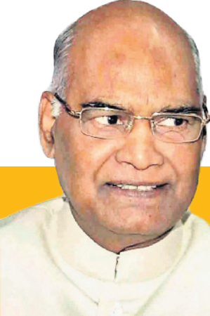
ಉಪ ಸಂಪಾದಕರು : ಟಿ.ಎನ್.ಮಧುಕರ್