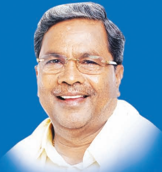
ಶ್ರೀ ಸಿದ್ದರಾಮಯ್ಯ ಸನ್ಮಾನ್ಯ ಮುಖ್ಯಮಂತ್ರಿಗಳು