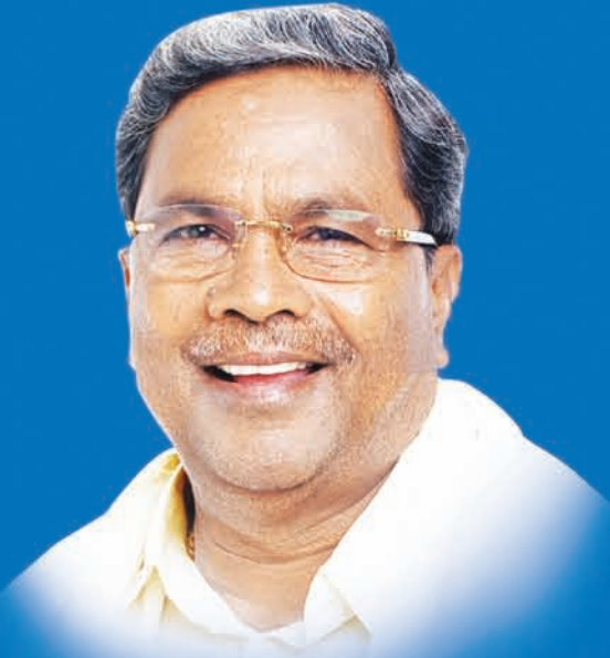
ಶ್ರೀ ಸಿದ್ದರಾಮಯ್ಯ ಸನ್ಮಾನ್ಯ ಮುಖ್ಯಮಂತ್ರಿಗಳು