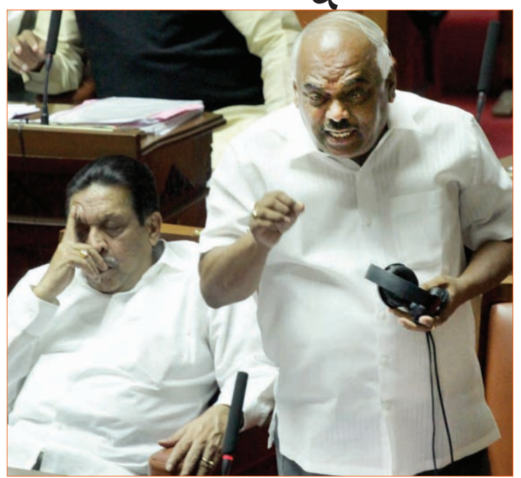
ಖಾಸಗಿ ಆಸ್ಪತ್ರೆಗಳನ್ನು ನಿಯಂತ್ರಿಸುವ ವಿಧೇಯಕವನ್ನು ಮಂಡಿಸಿ ಸಚಿವರು, ಜಂಟಿ ಸದನ ಸಮಿತಿಗೆ ಒಪ್ಪಿಸಿದರೆ ಆ ವಿಧೇಯಕ ವಿಳಂಬವಾಗುವುದು ಎಂಬ ವಿಚಾರವನ್ನು ಮುಕ್ತ ಚರ್ಚೆಗೆ ಅವಕಾಶ ಮಾಡಿಕೊಡಲಾಗುವುದು. ನಿಮ್ಮ ಗೊಂದಲಗಳನ್ನು ಹೇಳಿ ಖಾಸಗಿ ಆಸ್ಪತ್ರೆಗಳನ್ನು ನಿಯಂತ್ರಿಸಲು ಮುಂದಾಗಿರುವ ಸರ್ಕಾರದ ಯೋಜನೆಗಳನ್ನು ವಿವರಿಸಿದರು.

ಬೆಂಗಳೂರು ಖಾಸಗಿ ಆಸ್ಪತ್ರೆಗಳನ್ನು ನಿಯಂತ್ರಿಸಲು ಸರ್ಕಾರ ವಿಧೇಯಕ ತರಲು ಮುಂದಾಗಿದ್ದು, ಇದರಿಂದ ಯಾವುದೇ ಕಾರಣಕ್ಕೂ ಹಿಂದೆ ಸರಿಯುವ ಪ್ರಶ್ನೆಯೇ ಇಲ್ಲ ಎಂದು ಆರೋಗ್ಯ ಮತ್ತು ಕುಟುಂಬ ಕಲ್ಯಾಣ ಸಚಿವ ರಮೇಶ್ ಕುಮಾರ್ ವಿಧಾನಸಭೆಯಲ್ಲಿ ಸ್ಪಷ್ಟಪಡಿಸಿದರು. ಕೋಟಾ ತೀರ್ಮಾನದ ಪ್ರಶ್ನೆಗೆ ಸಚಿವರು ಉತ್ತರಿಸುತ್ತಿದ್ದ ವೇಳೆ ಪ್ರತಿಪಕ್ಷದ ನಾಯಕ ಕೆ.ಎಸ್. ಈಶ್ವರಪ್ಪ ಮಧ್ಯಪ್ರವೇಶಿಸಿ ಖಾಸಗಿ ಆಸ್ಪತ್ರೆಗಳನ್ನು ನಿಯಂತ್ರಿಸುವ ವಿಧೇಯಕ ಬಗ್ಗೆ ಮುಕ್ತ ಚರ್ಚೆಗೆ ಅವಕಾಶ ಮಾಡಿ ಕೊಡಲಾಗಿದೆ. ಇಲ್ಲವೆಂದು ಸಚಿವರು ಸದನ ಸಮಿತಿಗೆ ಒಪ್ಪಿಸಿ, ಸಾಧಕ-ಬಾಧಕಗಳ ಬಳಕೆ ಜಾರಿಗೆ ತನ್ನ ಎಂದು ಆಗ್ರಹಿಸಿದರು. ಈಗಾಗಲೇ ವಿಧೇಯಕವನ್ನು ವಿಧಾನ ಸಭೆಯಲ್ಲಿ ಮಂಡಿಸಿದ್ದು, ಅದನ್ನು ಅಂಗೀಕರಿಸಿದ ನಂತರ ವಿಧಾನ ಪರಿಷತ್‌ನಲ್ಲಿ ಮಂಡಿಸಿ ಸದನದ ಒಪ್ಪಿಗೆ ಪಡೆದು ವಿಧೇಯಕವನ್ನು ಜಾರಿ ಮಾಡಲು ತೀರ್ಮಾನಿಸಲಾಗಿದೆ. ಇದರಲ್ಲಿ ಹಿಂದೆ ಸರಿಯುವ ಪ್ರಶ್ನೆಯೇ ಇಲ್ಲ ಎಂದು ಹೇಳಿದರು. ಖಾಸಗಿ ಆಸ್ಪತ್ರೆಗಳನ್ನು ನಿಯಂತ್ರಿಸುವ ವಿಧೇಯಕವನ್ನು ಮಂಡಿಸಿ ಸಚಿವರು, ಜಂಟಿ ಸದನ ಸಮಿತಿಗೆ ಒಪ್ಪಿಸಿದರೆ ಆ ವಿಧೇಯಕ ವಿಳಂಬವಾಗುವುದು ಎಂಬ ವಿಚಾರವನ್ನು ಮುಕ್ತ ಚರ್ಚೆಗೆ ಅವಕಾಶ ಮಾಡಿಕೊಡಲಾಗುವುದು. ನಿಮ್ಮ ಗೊಂದಲಗಳನ್ನು ಹೇಳಿ ಖಾಸಗಿ ಆಸ್ಪತ್ರೆಗಳನ್ನು ನಿಯಂತ್ರಿಸಲು ಮುಂದಾಗಿರುವ ಸರ್ಕಾರದ ಯೋಜನೆಗಳನ್ನು ವಿವರಿಸಿದರು.