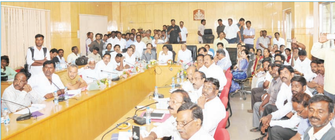
ಜಿಲ್ಲಾಕಾರಿಗಳ ಸಭಾಂಗಣದಲ್ಲಿ ನಡೆದ ಎತ್ತಿನಹೊಳೆ ಯೋಜನೆ ಕುರಿತಾದ ಜಿಲ್ಲಾ ಮಟ್ಟದ ಸಭೆಯಲ್ಲಿ ಪ್ರಾತ್ಯಕ್ಷಿಕೆ ವೀಕ್ಷಿಸುತ್ತಿರುವ

ತುಮಕೂರು ಕೊರಟಗೆರೆ ತಾಲ್ಲೂಕಿನ ಬೈರಗೊಂಡು ಗ್ರಾಮದಲ್ಲಿ ಎತ್ತಿನಹೊಳೆ ಯೋಜನೆ ಯಡಿಯಲ್ಲಿ ಜಲಾಶಯವನ್ನು ನಿರ್ಮಿಸಲು ಯೋಜಿಸಲಾಗಿದ್ದು ಭೂಪರಿಹಾರ ಮತ್ತು ಪುನರ್ವಸತಿಗೆ ಸಂಬಂಧಿಸಿದಂತೆ ಸ್ಥಳೀಯರಿಂದ ವಿರೋಧ ವ್ಯಕ್ತವಾಗಿದೆ. ಕರ್ನಾಟಕ ಸರ್ಕಾರದ ಮಹತ್ವಾಕಾಂಕ್ಷಿ ಯೋಜನೆಯಾದ ಎತ್ತಿನಹೊಳೆ ಯೋಜನೆಯಲ್ಲಿ ಕಾಮಗಾರಗಳು ಭರದಿಂದ ಸಾಗಿದ್ದು, ನೀರು ಸಂಗ್ರಹಣೆಗೆ ಉದ್ದೇಶಿಸಿರುವ ಬೈರಗೊಂಡು ಸಂಗ್ರಹಾರದ ಸುತ್ತಮುತ್ತಲ ವ್ಯಕ್ತಿಗಳಿಂದ ಅಸಮಾಧಾನ ವ್ಯಕ್ತವಾಗುತ್ತಿದೆ.